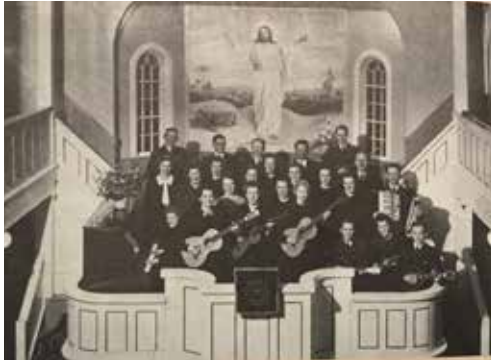
Musikföreningen i Norrkyrkan 1942 (ur Falbygdens Missionsblad nr 4-1971)